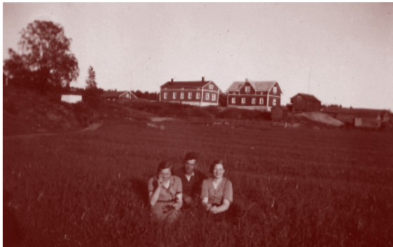
Airismaan Itätalon (vasemmalla) ja Länsitalon eli Hämmärön päärakennusten väli on vain neljä metriä.

Länsitalossa 1920-luku oli uuden pellon raivauksen aikaa. Vuokratalojen itsenäistyminen muutti merkittävästi Hämmärön kylän maanomistussuhteita. Rymättylän kunta osti Pohjatalon ja perusti sinne kansakoulun. Hämmärön kylässä oli nyt koulu, kauppa sekä säännöllinen höyrylaivayhteys Turkuun. Airismaan kylätie yhdisti Hämmärön kylän sekä muihin kyliin että mantereeseen suuntaan. Länsitalon läheisyydessä oli Fältinranta, jota käytettiin kulkuyhteytenä mm. viereisestä Aaslan saaresta.