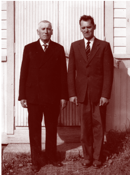
Isä ja poika, Länsitalon isännät